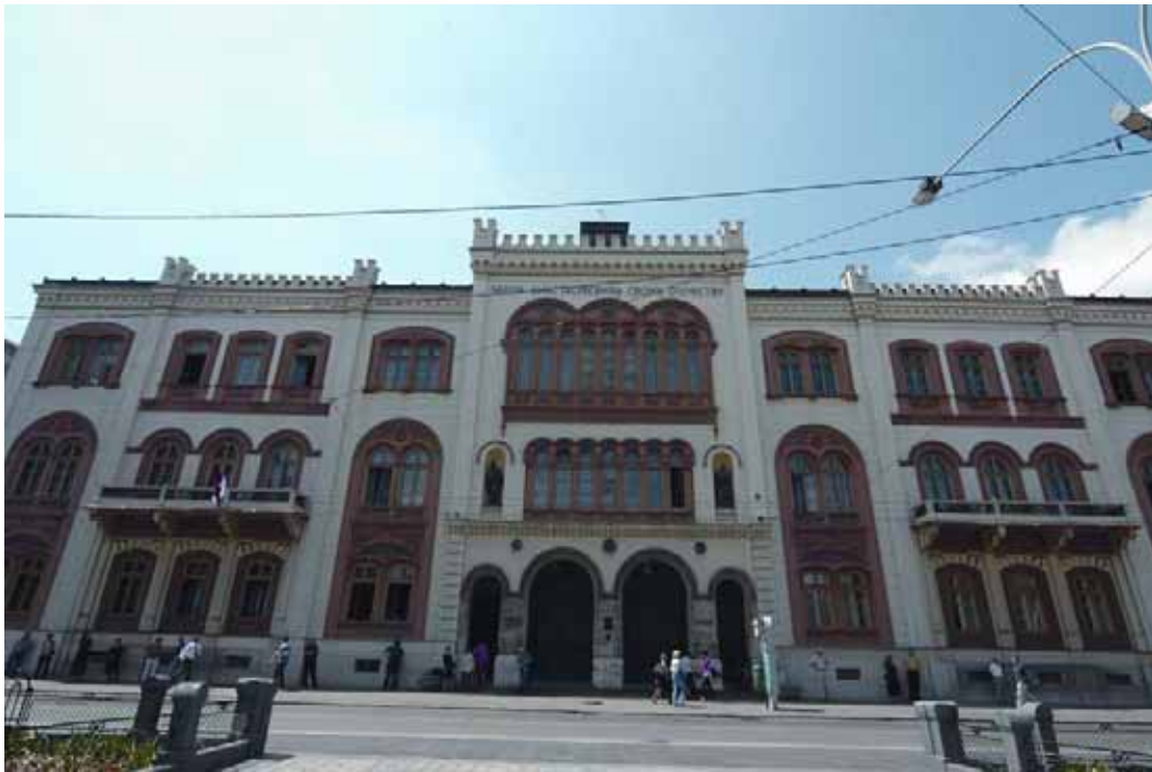
Beograd, 2007. Belgrade, 2007.